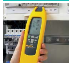
Localisation des fusibles et affectation aux circuits